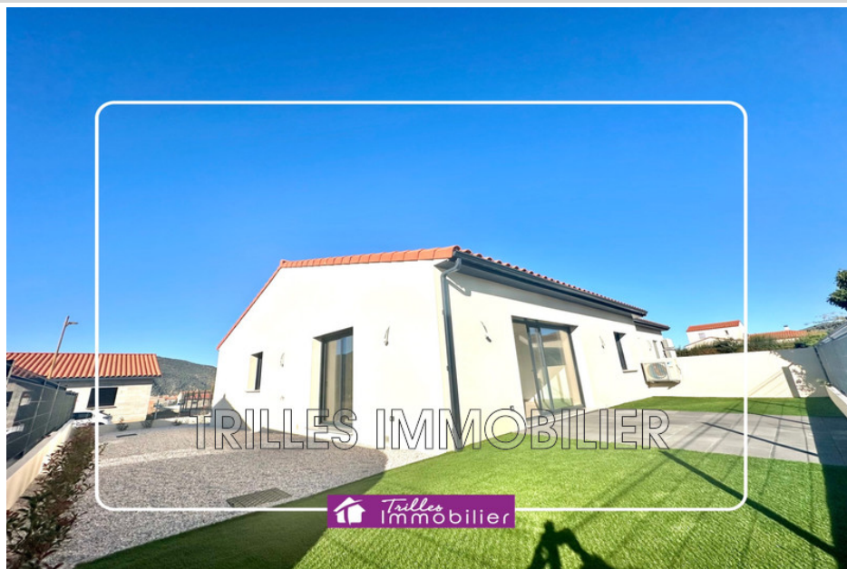
Villa 1406 Vinça

Belle opportunité !!! Villa 3 faces à étrenner, jamais habitée. De construction traditionnelle "Briques" vous y découvrirez une superficie habitable de 85 m 2 + un garage de 14 m 2 . Le tout sur une parcelle de 284 m 2 . Une agréable terrasse carrelée accessible de la spacieuse pièce de vie de fonctionnelle et baignée de lumière. Elle vous offrira aussi des prestations de qualité telles que la climatisation gainable sur l'ensemble de la villa ; un chauffe-eau thermodynamique ; double vitrage, volets électriques... Côté nuit, elle dispose de trois grandes chambres avec chacune un emplacement pour un dressing. Une belle salle d'eau moderne avec douche à l'italienne viendra compléter l'espace nuit. Les plus : Un garage entièrement carrelé avec porte motorisée ainsi qu'une place de stationnement à l'avant de la maison. DPE en cours Les informations sur les risques auxquels ce bien est exposé sont disponibles sur le site Géorisques : www.georisques.gouv.fr .Réf mandat 1406. Honoraires charge vendeur.